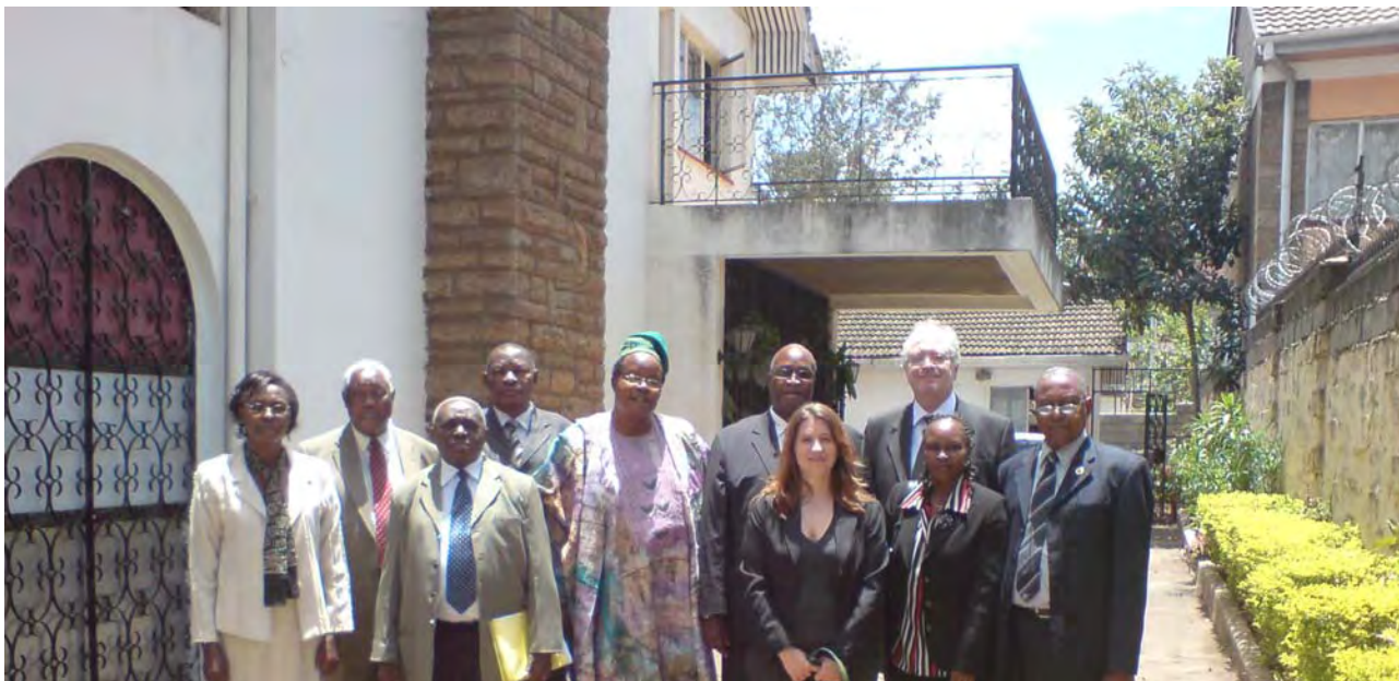
Les membres du Conseil Régional de l'Afrique Afrique et le personnel, à l'extérieur du Bureau, 2009

Le bureau régional a emménagé dans de nouveaux locaux à Nairobi. Le Conseil Régional de l'ACI Afrique nouvellement élu s'est réuni à Nairobi en février. Le Conseil a examiné plusieurs questions importantes pour le mouvement coopératif dans la région. Une journée entière a été réservée aux débats sur le Plan Stratégique Quadriennal pour le Renouveau Coopératif en Afrique. Le Conseil Régional s'est réuni trois fois en 2009.