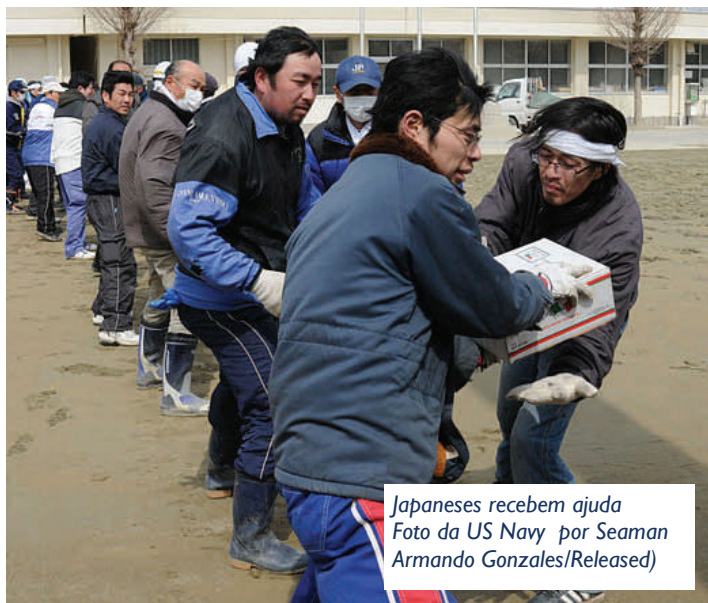
Japoneses recebem ajuda Foto da US Navy por Seaman Armando Gonzales/Released)

Os últimos meses presenciou o mundo sendo atingido por um número sem precedentes de crises naturais e humanas. Esta edição da ICA Digest traz relatórios da resposta do movimento cooperativo aos desastres ambientais no Japão e na Nova Zelândia e o movimento pró-democracia no Egito. É a última vez que você recebe o ICA Digest no formato atual—um novo e-newsletter nascerá em maio e após, será publicado mensalmente.