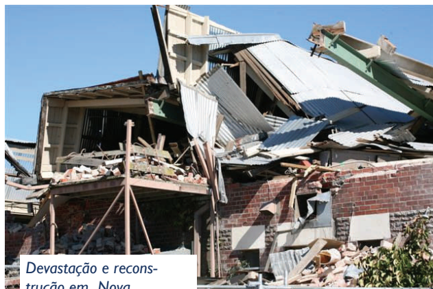
Devastação e reconstrução em Nova Zelândia