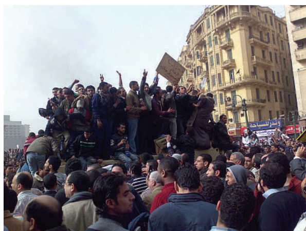
Rebeldes sobre um caminhão do exército em Tahrir Square, Cairo

Levou menos de três semanas para Hosni Mubarak, Presidente egípcio por três décadas, bater a retirada de Cairo após a rebelião dos egípcios clamando por democracia. Mas, como consequência da mudança do regime de