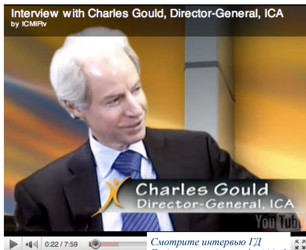
Смотрите интервью ГД Гулда на www.ica.coop/activities/

того, что станет непрерывной маркетинговой кампанией, брендинговой кампанией, а также обращением к обществу», - сказал он. «Это заставит людей понять, каким невероятным потенциалом обладают кооперативы для решения сегодняшних проблем».