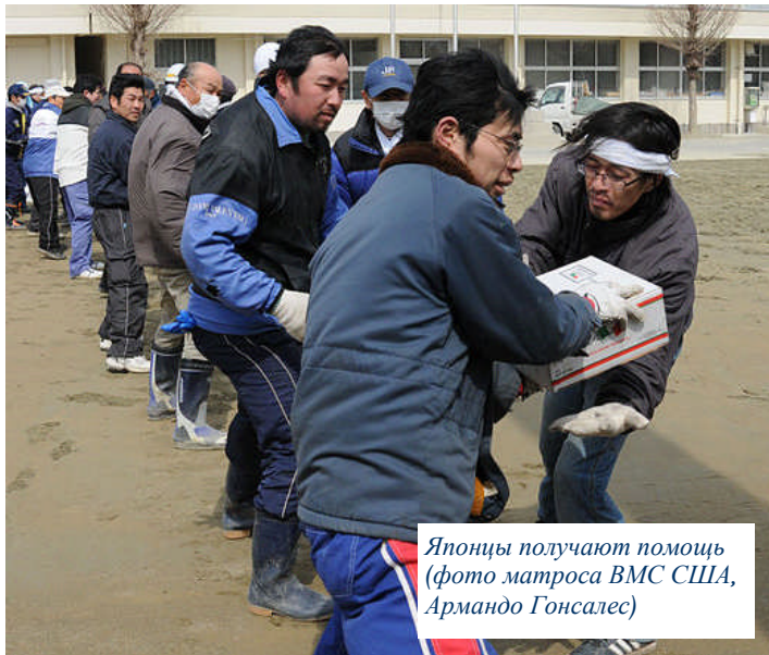
Японцы получают помощь

За последние месяцы мир испытал беспрецедентное количество природных и гуманитарных катастроф. В этом выпуске опубликованы статьи о реакции кооперативного движения на экологические бедствия в Японии и Новой Зеландии и на про-демократическое движение в Египте. Вы последний раз получаете Дайджест в таком виде – новый формат eNewsletter впервые выйдет в мае и будет публиковаться ежемесячно.